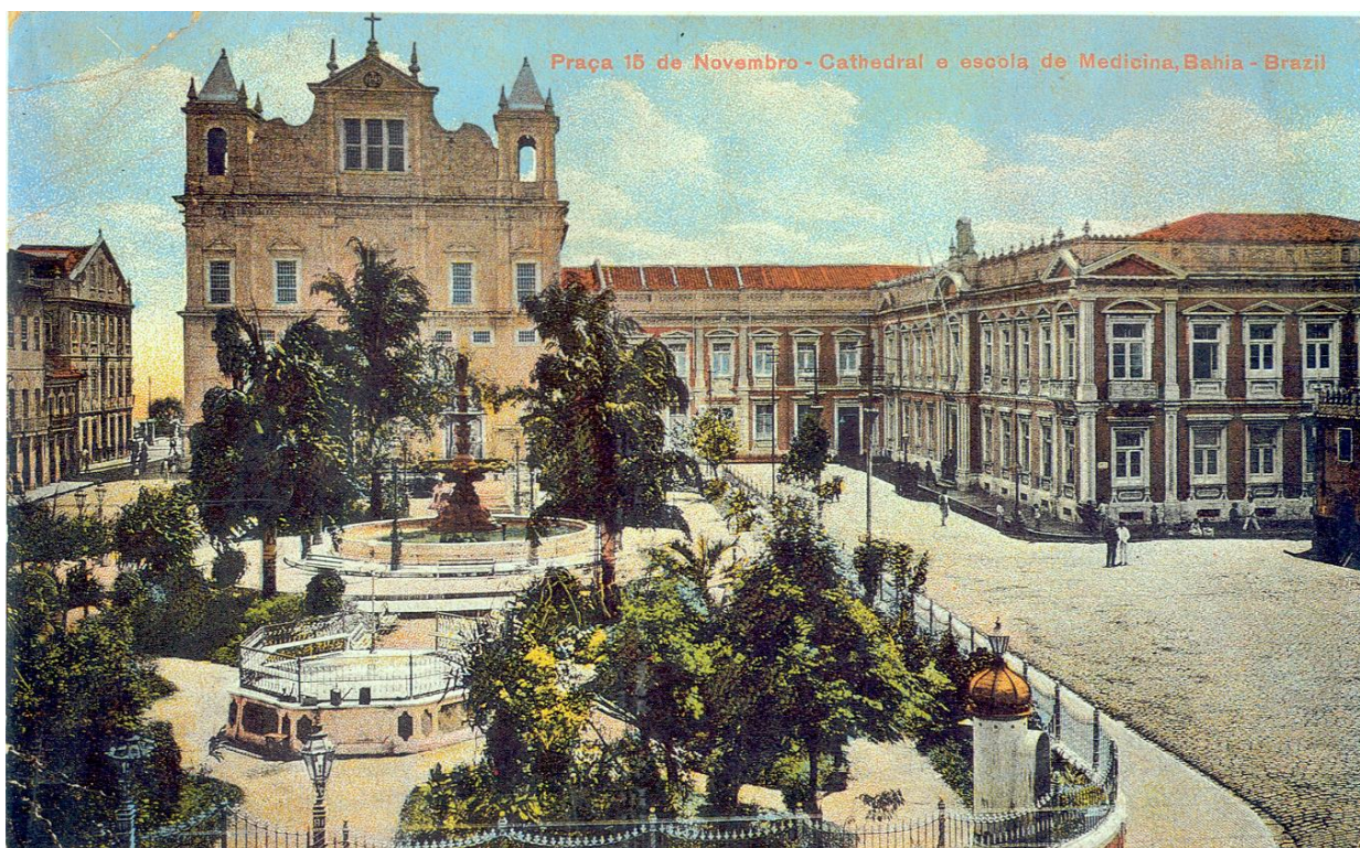
Figura 4. Catedral Basílica e Faculdade de Medicina da Bahia, na Praça 15 de Novembro (Terreiro de Jesus) – Centro Histórico de Salvador BA