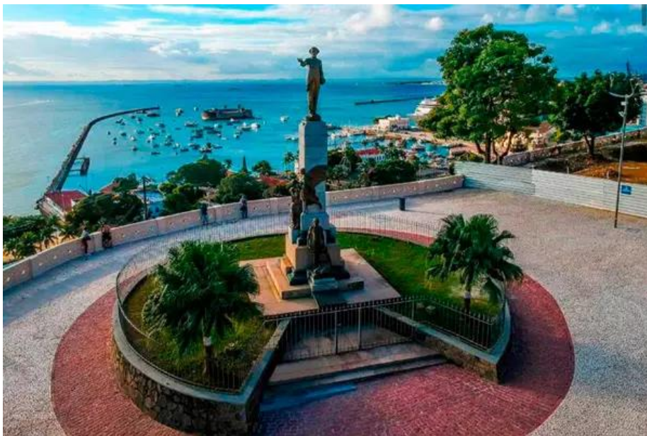
Fig. 6: Praça Castro Alves