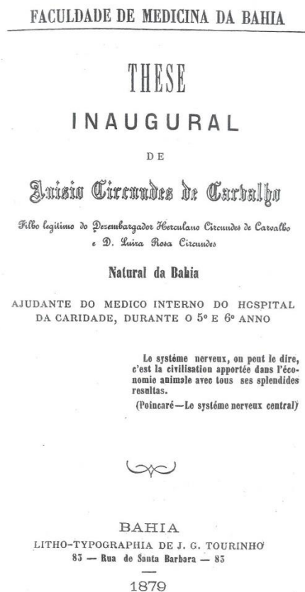
Fig. 3. Tese inaugural. Corpo docente da FMB-1879