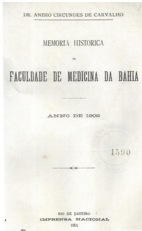
Fig. 2. Memória Histórica da FMB do ano de 1902