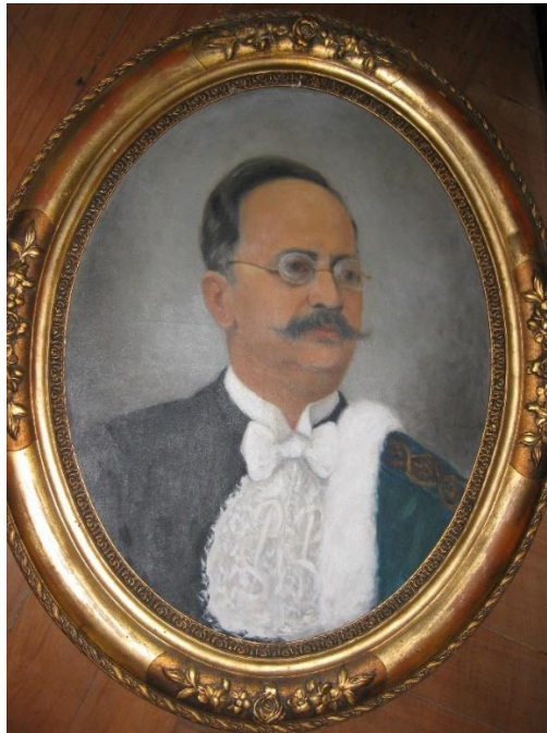
Fig. 1: Prof. Catedrático de Clínica Médica.