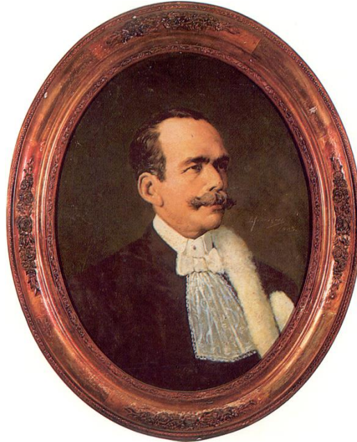
Fig. 1. Prof. Manoel Victorino Pereira, Lente de Clínica Cirúrgica. (1853-1902)