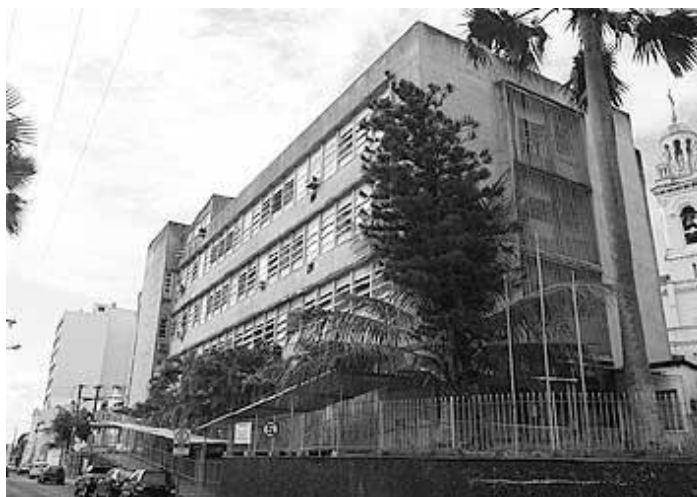
Figura 3 - Hospital Manoel Victorino, no bairro de Nazaré, em Salvador.

Pela sua brilhante trajetória, uma das ruas do Comércio foi intitulada Rua Manuel Victorino, bem como foi construído o Hospital que leva seu nome, no bairro de Nazaré.